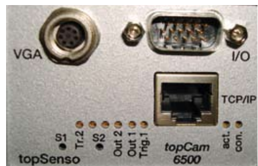
Rückwand mit diversen Anschlußsteckern